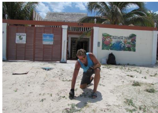
Figura 1. Casa de Segunda Residencia. Puerto Progreso

gubernamentales, servicios de salud, bienes raíces, pymes, asociaciones e instituciones educativas) para entender este segmento, dar una buena imagen del destino y crear la experiencia (Anáhuac, 2013), a fin de consolidar la oferta turística, explorando opciones como la de segunda residencia, profesionalizando los servicios que funjan como imán de atracción de residentes extranjeros.