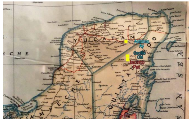
Fig.1 Lugares de residencia de los caudillos. Fuente: http://www.sefotur.yucatan.gob.mx/

informes de lo ocurrido al gobierno, poco después las fuerzas del gobierno yucateco, llegaron a Tepich, y en venganza, masacraron a todos los mayas que se habían quedado en el pueblo. Y así, la Guerra de Castas había comenzado en el 30 de julio de 1847, conflicto que duró hasta 1901.