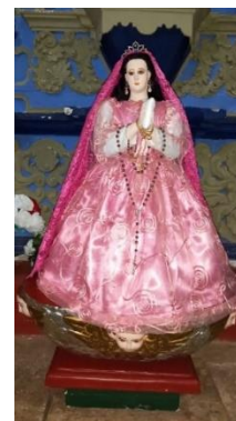
Fig. 5. Virgen de la Asunción.

resguardadas junto con la Virgen que se mantuvo intacta, fue rescatada y colocada en la iglesia de Yaxcabá para su resguardo, se cuenta que al día siguiente la imagen había desaparecido, grande fue la sorpresa al hallarla de nuevo en su nicho en la iglesia de Mopilá. Este hecho fue interpretado por los lugareños como un milagro, y el deseo de la Virgen de permanecer en la iglesia a la que pertenecía.