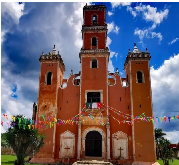
Fig. 3. Iglesia de Yaxcabá

Debido a la variedad de elevaciones que se pueden hallar en dicho lugar, se encuentra situado a una altitud promedio de 7 metros sobre el nivel del mar. Entre los lugares con los que Yaxcabá colinda, al norte se encuentra el municipio de Sudzal, al sur Chacsinkín, al este con Chankom y al oeste con el municipio de Sotuta. En 2020, la población en Yaxcabá fue de 16,350 habitantes (51.1% hombres y 48.9% mujeres). (DataMéxico, 2020).