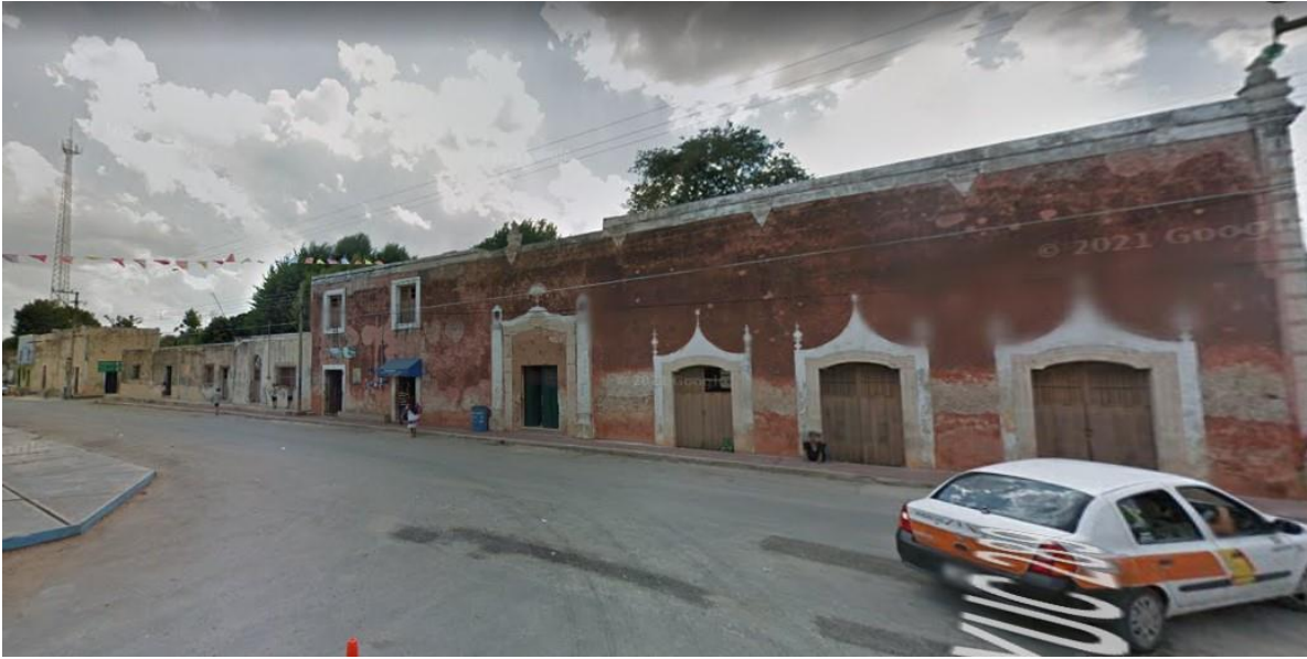
Fig. 6. Casonas en el centro de Yaxcabá.