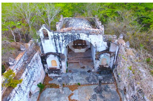
Fig. 4. Iglesia de Mopilá

Por tal motivo, se acordó llevarla cada año del 31 de julio, y acompañarla durante toda la noche con cantos, rezos, y demostraciones de devoción para que no se sienta sola, esta costumbre lleva poco más de cien años de efectuarse.