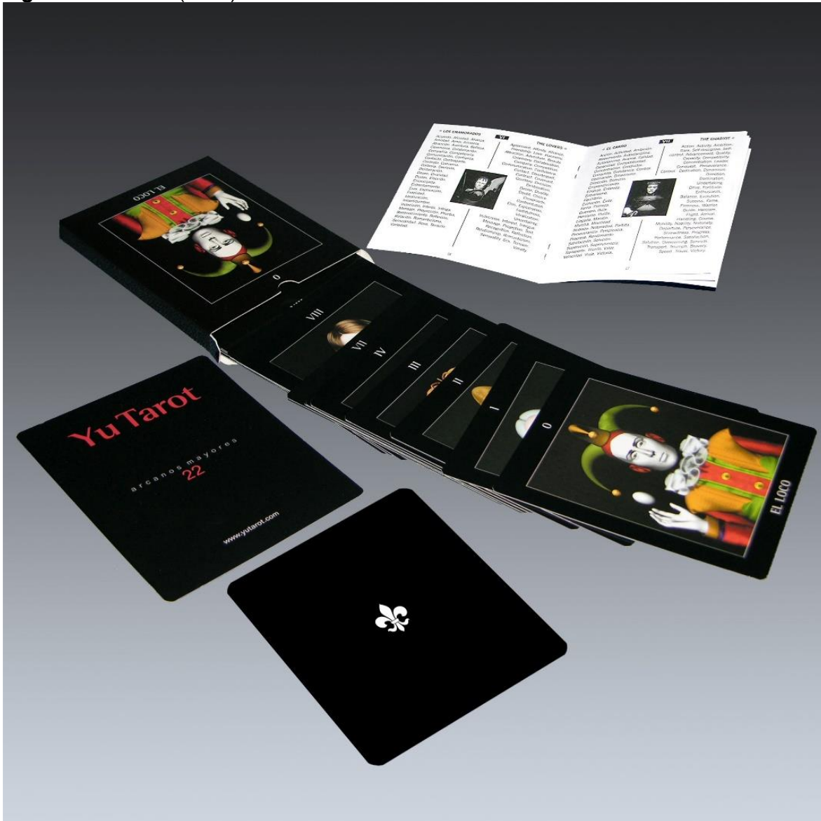
Figura 1: Yu Tarot (2006)