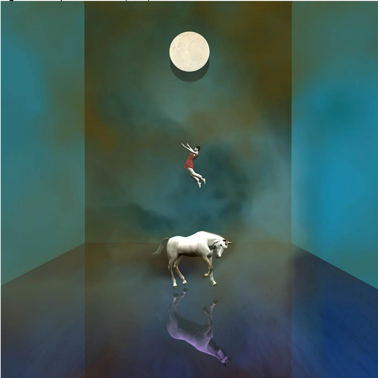
Figura 5: Reciprocal Oblivion (2023)