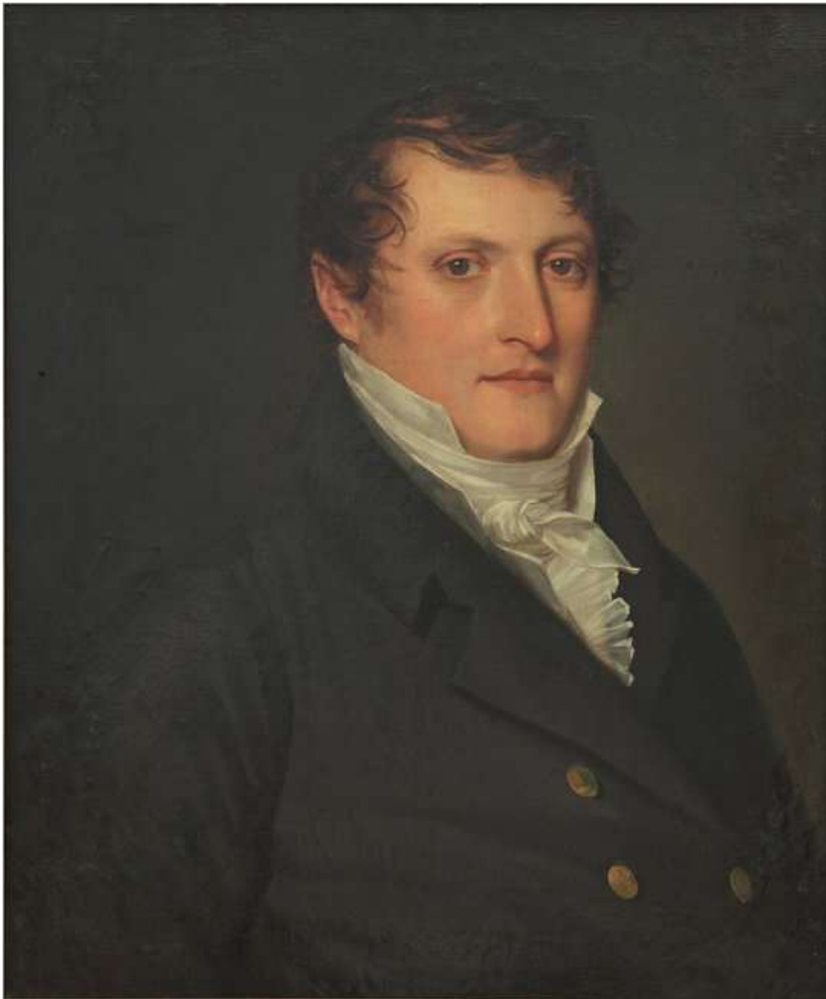
Figura 2: Retrato del Gral. Manuel Belgrano en Museo de Bellas Artes, Argentina, fuente: https://www.bellasartes.gob.ar/coleccion/obra/2778/

Journal of Science of Law, Doctorate Science of Law, National University of La Rioja, Province of La Rioja, Republic Argentina, 2020, Vol. 1, N°1, e-ISSN in process.