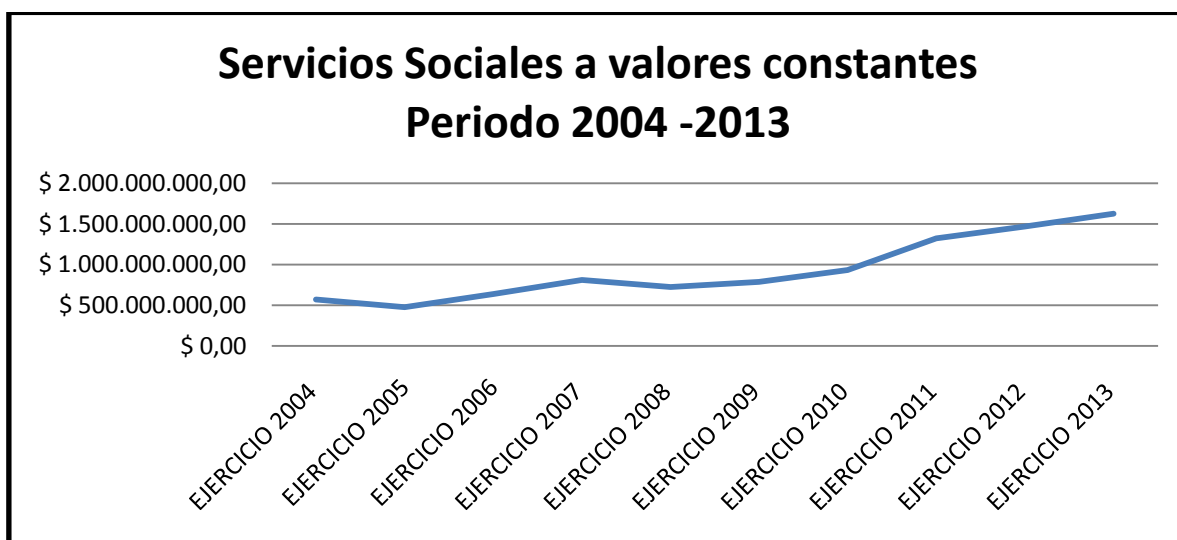
GRÁFICO N° 1